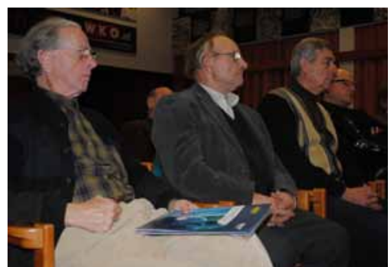
Interessierte Zuhörer beim Vortrag

Im Einsatz für unsere Gemeinde Das Team der ÖVP St. Veit