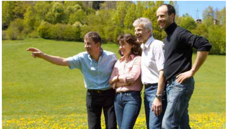
Die VP-Gemeinderäte für Sie im Einsatz

Der parallel dazu über 1 Jahr entwickelte textliche Bebauungsplan und auch der Flächenwidmungsplan hatten im Herbst nach langer und intensiver Arbeit aller Frakti-