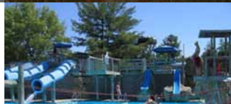
Wasser in verschiedenen Formen erleben