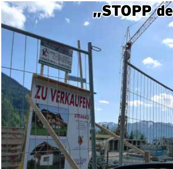
Landschaftsverbauung als Spekulationsgeschäft

1 Jahr befristete Bausperre, lange Diskussionen und viel Geld für Detailplanungen wurden ausgegeben. Trotz großer Wortspenden am Anfang des Prozesses, war das Ergebnis ernüchternd.