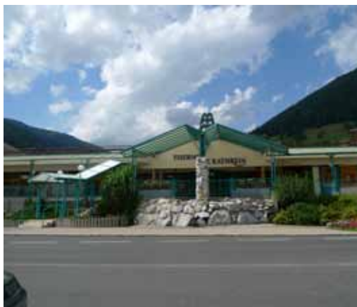
Die Therme im „alten Glanz“