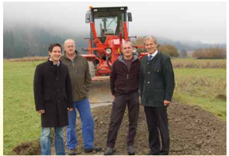
Wegsanierung Vorderberg West

Sie gestalten unsere für St. Stefan so typische Natur- und Kulturlandschaft und erzeugen Spezialitäten höchster Qualität unter dem Aspekt der Umweltschonung. Die Tourismus- und Freizeitwirtschaft profitiert davon und unserer Lebensqualität wird nachhaltig verbessert. Darum müssen wir den Erhalt sichern und fördern!