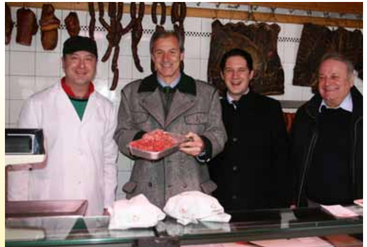
Betriebsbesuch bei der Fleischerei Smole