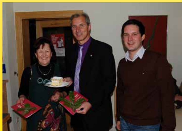
Betriebsbesuch Ortsburg Vorderberg

Im Einsatz für unsere Gemeinde Das Team der ÖVP St. Stefan