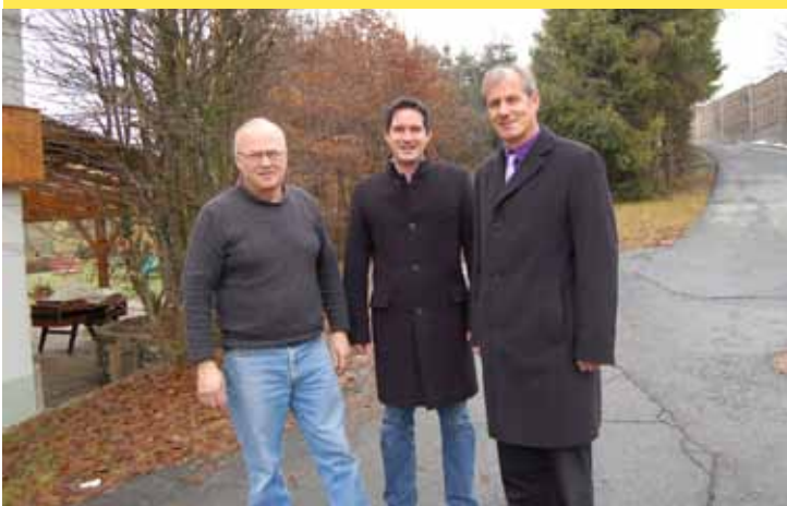
Betriebsbesuch Karnischer Hof