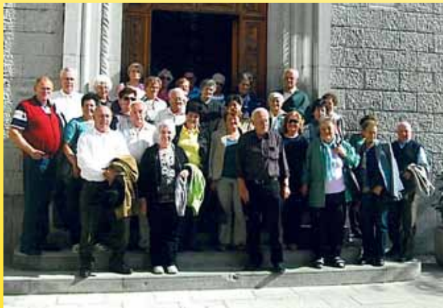
Teilnehmer beim Ausflug nach Slowenien und Friaul am 23.9.2010 vor der Wallfahrtskirche Castelmonte