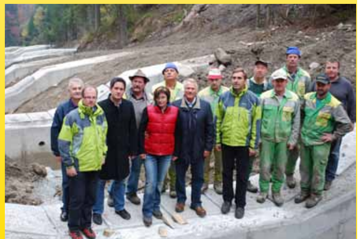
Die Wildbachverbauung im Bereich Dolinza Alm wurde heuer abgeschlossen.

Im Einsatz für unsere Gemeinde Das Team der ÖVP St. Stefan