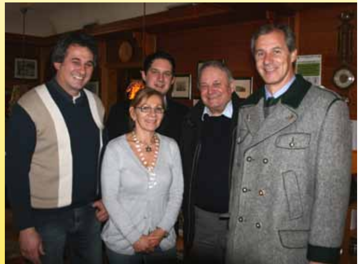
Betriebsbesuch im GH Robin