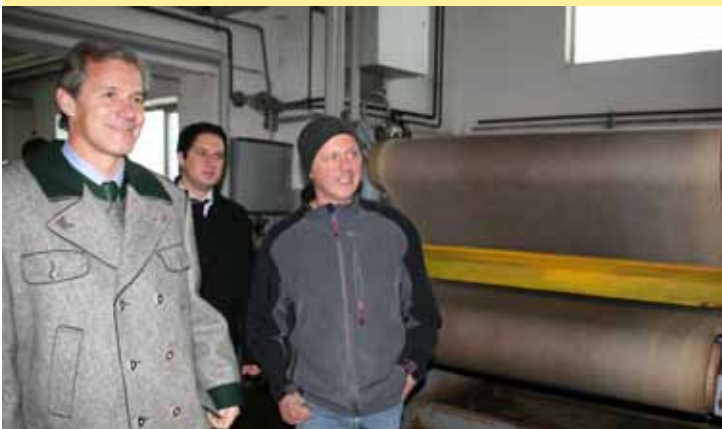
Betriebsbesuch bei der Gerberei Tschurtschenthaler