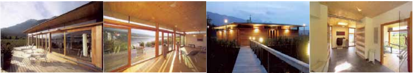
Moderne Passivenergiekonstruktion mit viel Holz und Glas